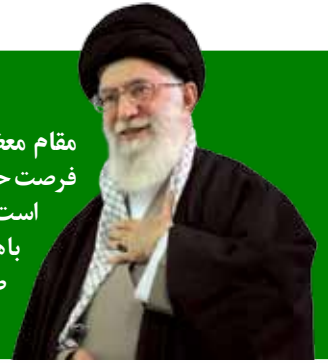
مقام معظم رهبری

فرصت حج، فرصت ورود یک انسان در فضای بیکرانہی معنویت است؛ از لایه لایه زندگی معمولی خودمان باهمه‌ی آلودگی‌هایش، باهمه‌ی اشکالاتش، خودمان را بیرون می‌کشیم و به فضای صفا و معنویت و تقرب الی الله و ریاضت اختیاری می‌رویم. خطاب به کارگزاران حج ۱۳۸۷