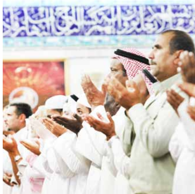
مدینه منوره - مسجد شیعیان